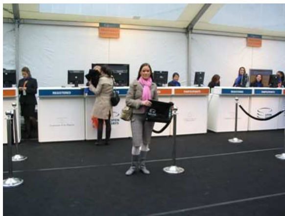
Regisztrációs sátor október 05.