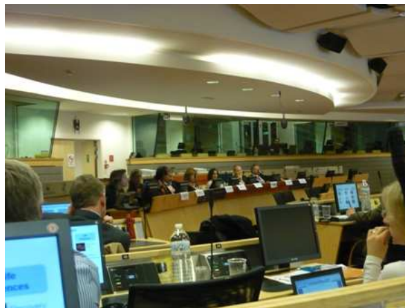
„Speakers of Healthymagination workshop”

Betekintést nyerhettünk a PEHR – Personal Electronic Health Record rendszerébe, amelynek a célja, hogy a páciens legyen a középpontban, miközben a program biztonságos adatrögzítést és védelmet biztosít, az egészségügyi szakemberekhez eljuttatja a szükséges információkat a betegről, technikailag a legegyszerűbb eljárás, ugyanakkor költségkímélő. A program effektív használatához természetesen szükség van a megfelelő előkészületekre, általános szabályozásra, belső képzésekre, a páciensek tájékoztatására, betanítására, és a páciens-szakember közötti kölcsönös bizalomra.